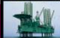
Off-Shore- und Erdölindustrie