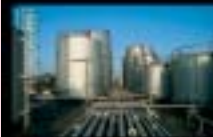
Chemie- und Pharmasanlagen